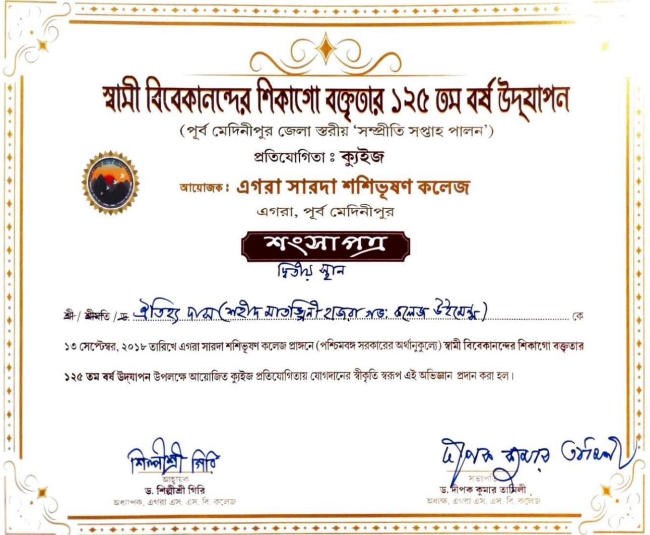
Fig: Certificate of One Week observation on Swami Vivekanander Chicago Boktritar 125 th Barsha Udjapan